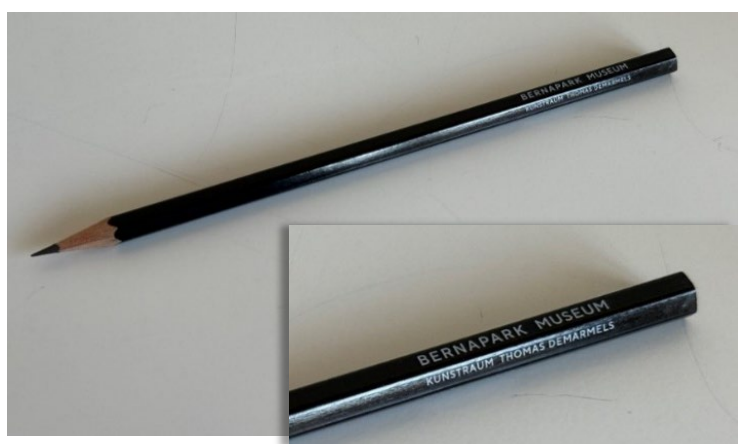
Der neue Caran d'ache-Bleistift mit "Bernapark Museum - Kunstraum Thomas Demarmels" Aufdruck (oben) und die neue Baumwolltasche mit dem Motiv «Zitrone» (rechts).

Die Kunst und Kultur Bernapark AG hat sich dafür entschieden, neben einem neuen Imagefilm und einem überarbeiteten Kunstkatalog auch die Kosten für die Anschaffung der neuen Give-Aways (Caran d'Ache-Bleistift sowie die Baumwolltasche) zu übernehmen. Herzlichen Dank!