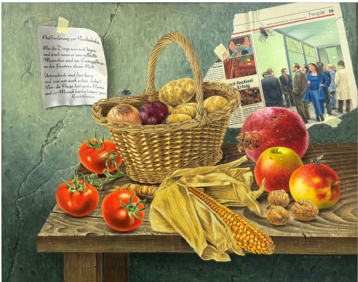
Thomas Demarmels «Aufforderung zur Bescheidenheit», 2011